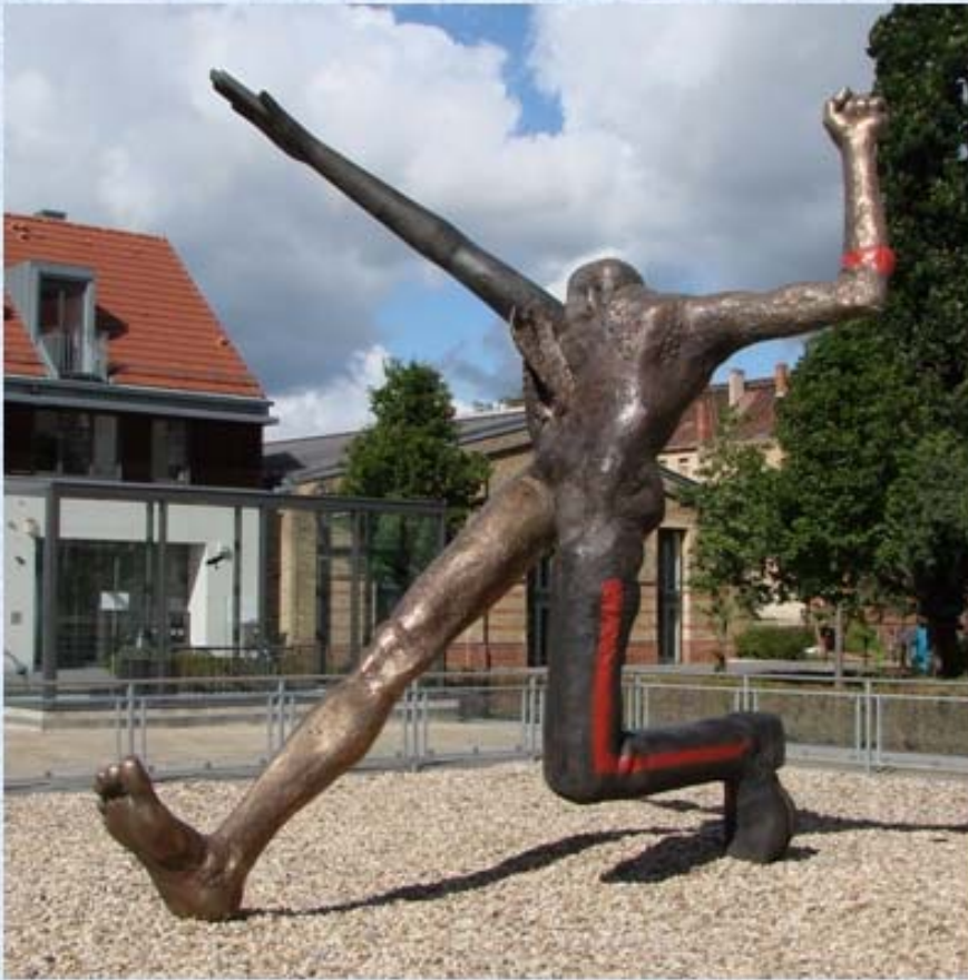
Jahrhundertschritt (Wolfgang Matheuer)