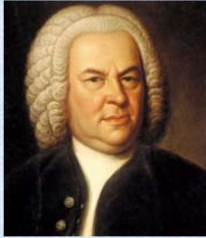
Johann Sebastian Bach